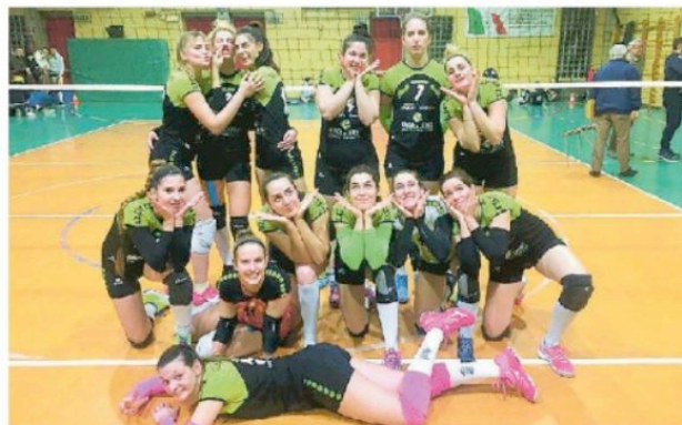
La VolleyBas Banca di Udine riesce a festeggiare per aver strappato un punto alla capolista

Sandri ha provato il doppio cambio ma il set è andato alle ospiti. Decisiva la terza